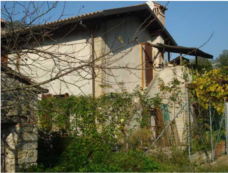
Lato Sud Est