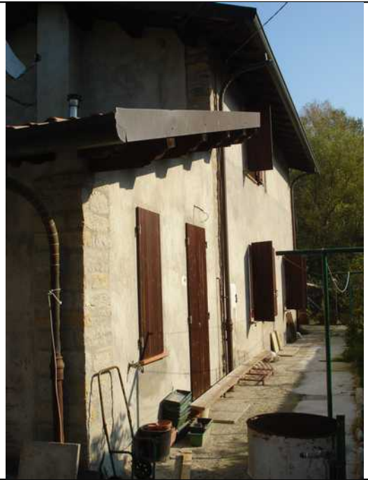
Lato Sud Ovest